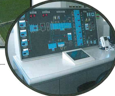
中央監視モニター