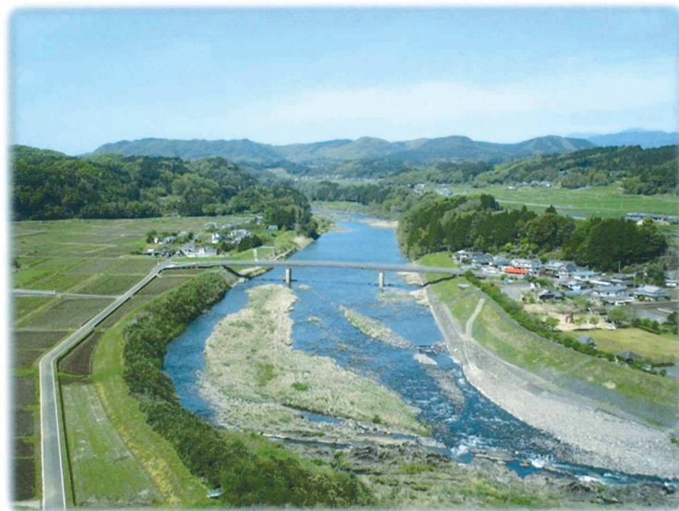
大野川河岸段丘 江内戸の景