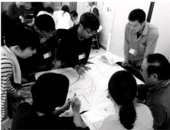
防災士試験の様子