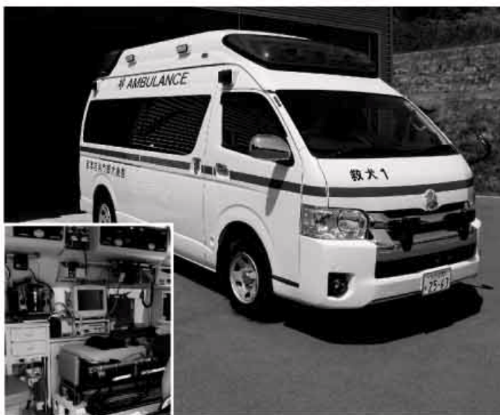
救急車とその内部

救急件数は平成22年度以降2100件前後で推移しており、現場到着時間は平均8・4分です。 救急救命士の任務拡大がなされているが、今後も養成、研修に計画的に取り組みます。