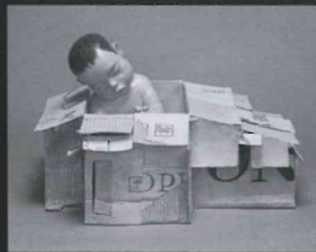
第12回【優秀賞】 NO SPACE TO PLAY ナルディ インドネシア