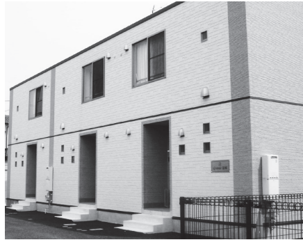
新規就農者宿泊施設イメージ図