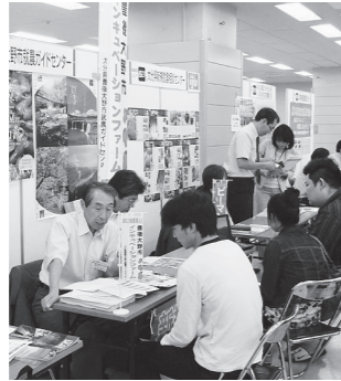
新・農業人フェア(東京会場)

新 たに就農しようとする者に対し、ピーマン栽培などに必要な技術および知識の付与その他の支援を行う事業の実施により、本市における農業の担い手となるべき優秀な人材の確保およびその育成を図り、もって定住人口の増加に資するために、条例を制定するものです。