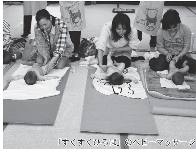
「すくすくひろば」のベビーマッサージ

こうした状況を踏まえ、平成24年度地方財政計画、地方交付税拡充、公共サービスに必要な財源確保のため意見書の提出を求めるもの。