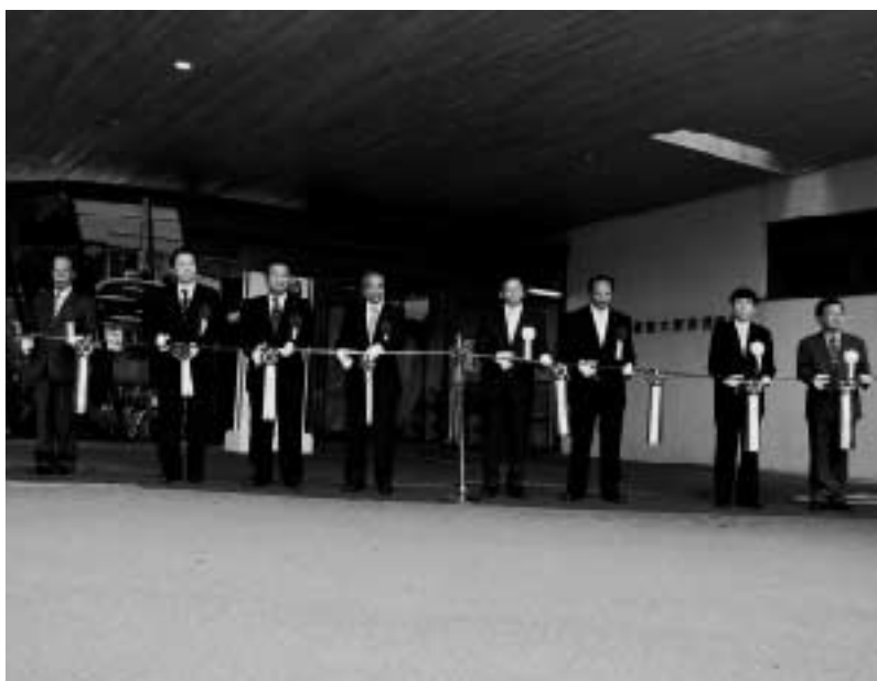
豊後大野市民病院開院式

地域の中核病院として住民の生命と健康を守るために、安全で最新の医療と救急医療の提供を目指します。また、豊かな地域づ