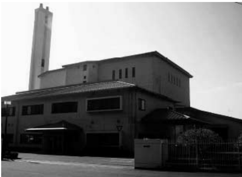
豊後大野市清掃センター