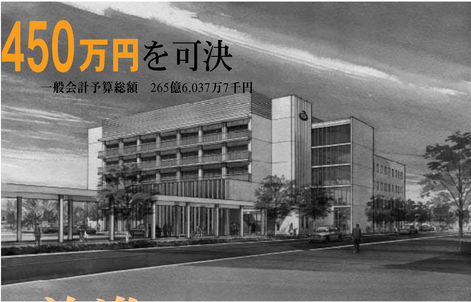
新庁舎外観イメージ図北側