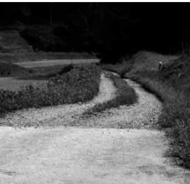
未舗装の市道（大野町）

本年度から支給限度額を30万円に引き上げましたが、今後、支給基準の見直しについて協議を重ねて検討していきたいと考えています。