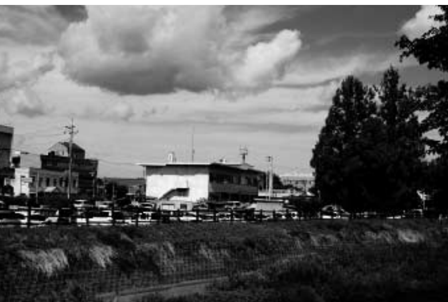
新庁舎建設予定地南側