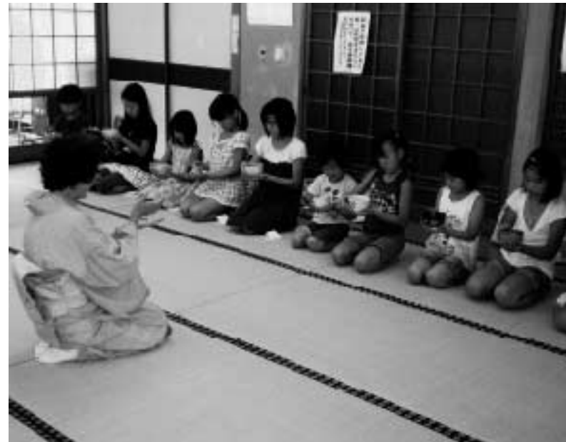
中央公民館子ども教室 (三重町)

しかしながら、社会教育の振興や生涯学習が地域活性化に多大な貢献をしているので、各町の公民館は存続すべきで、公民館活動の衰退を招かない組織づくりが重要だと考えています。 また、自治公民館活動の充実を図るため、地域担当職員制度を活用してまいりたいと考えています。