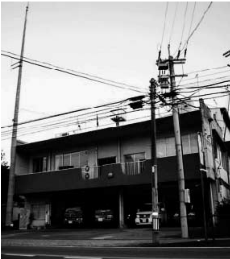
豊後大野市消防本部