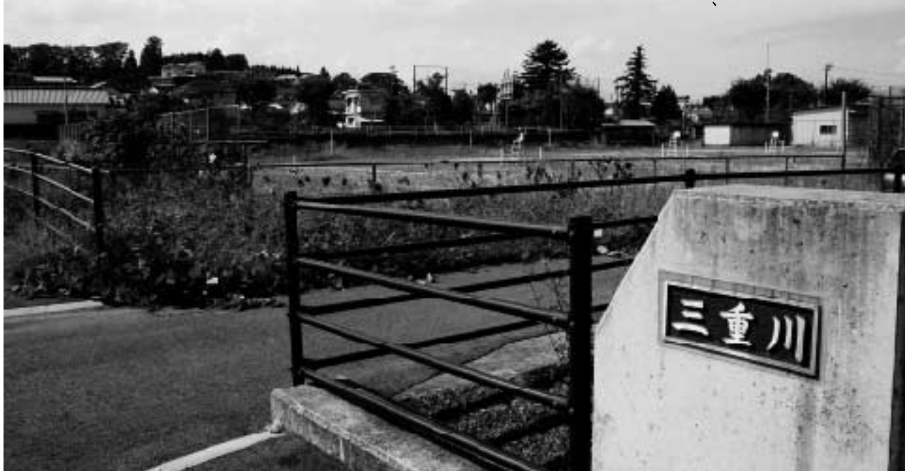
消防庁舎建設予定地

答 消防長 旧三重高校テニスコートは経済性を含めて、市内全域での迅速な災害対応と、三重町の人口密集地での火災に対応が可能な場所と考えています。ヘリポートの建設につきましても、費用対効果の観点からも建設を見送ったところがございます。