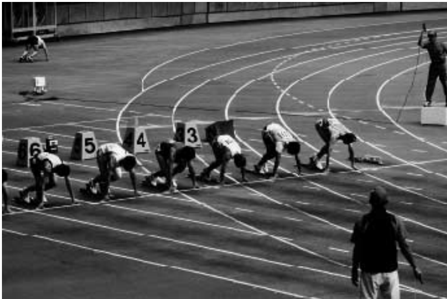
第63回大分県民体育大会

強化費は基本額に加え、支部加算額、市民体育大会の開催団体や、県民体育大会の参加団体に加算し、支出して