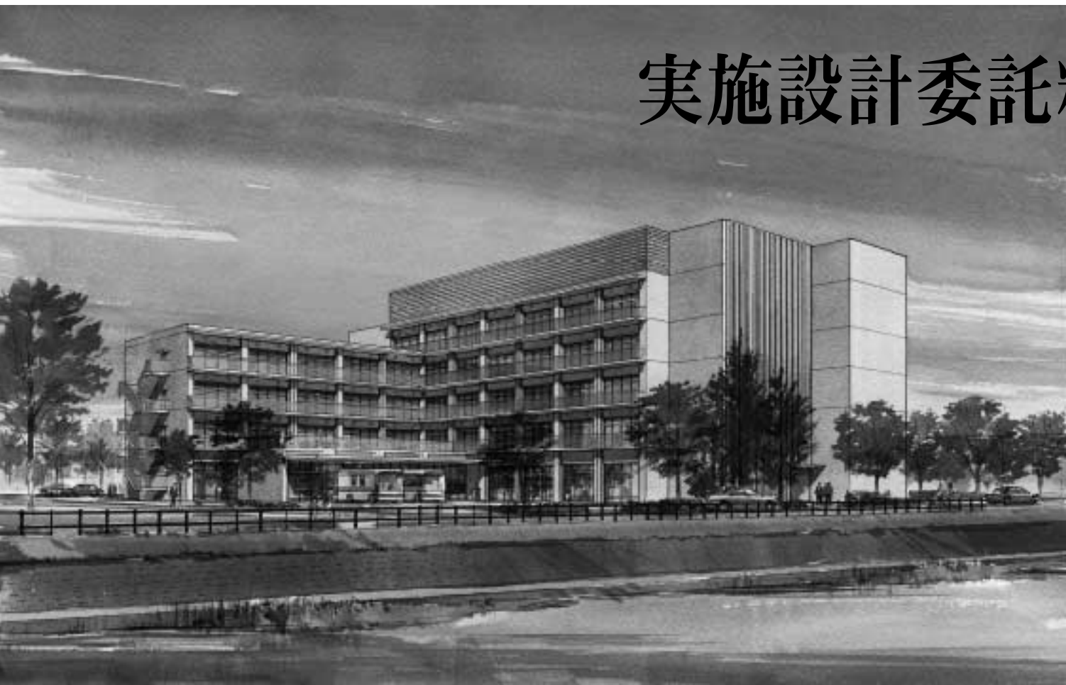
新庁舎外観イメージ図南側