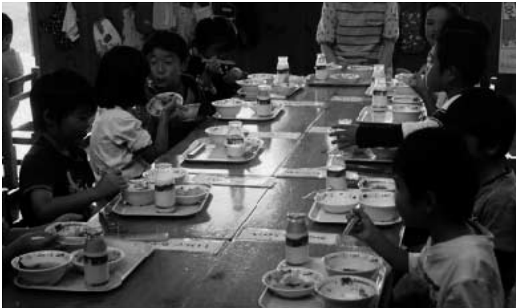
給食風景（朝地小学校）

基本的な生活習慣の確立が必要不可欠。TRY（トライ）運動などを推進していく上で、