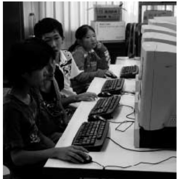
パソコンでの学習風景（千歳小学校）