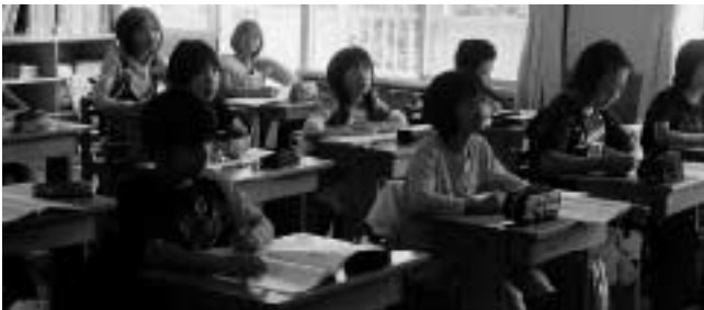
授業風景（清川小学校）

中学校では国語Bを除いた全ての問題で全国平均を2・2から3・5ポイント上まわり、県平均は4・2から5・3ポイント上まわった。今後、授業の改善、並びに基礎・基本の定着を図る補充学習の徹底が必要であり、これからは全国や県下の児童生徒と比べても「遜色のない学力」を身につけなければと考えています。