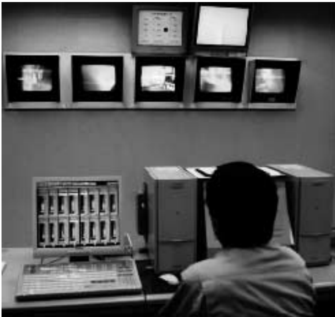
焼却状況などを監視