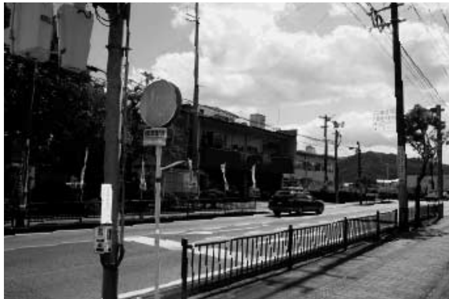
新庁舎建設予定地北側