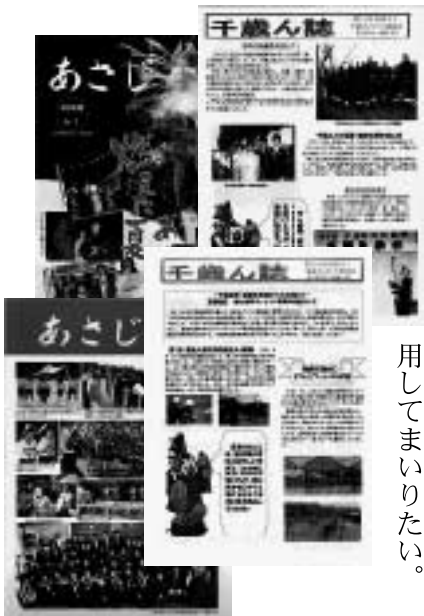
団体が発行する広報誌

各町で執行されてい る各種事業などについ ては、市報で十分に掲 載できていない状況で す。新たな発行は困難 だが、今後は紙面のあ り方などを検討します。 またケーブルテレビ の市民チャンネルを活 用してまいりたい。