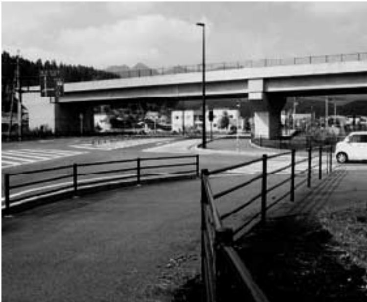
大野インター出口交差点