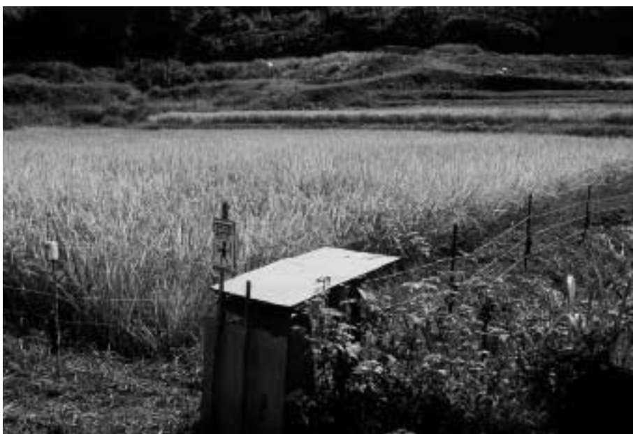
ほ場に設置している電気柵 (大野町)

答 市長 当初予算に303万円を計上しています。さらに今回、シカ1頭の補助単価を8千円から1万円に変更するための増額補正を提案しています。