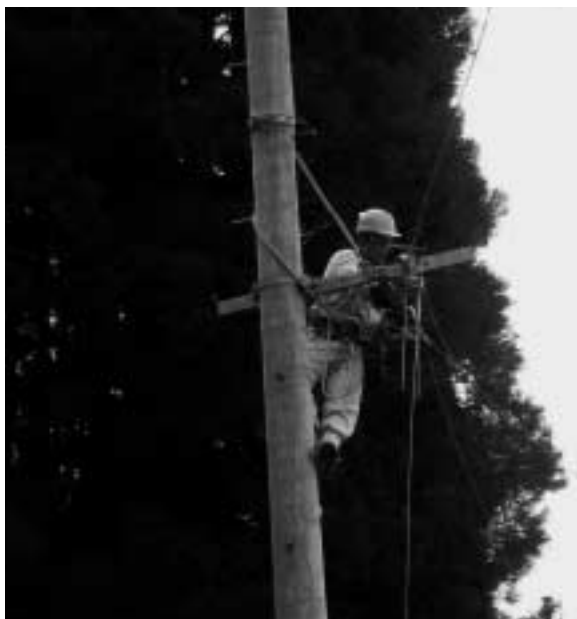
ケーブル敷設工事

本年度一般会計における、投資的経費は106事業で、総額40億3058万円です。 執行状況は、8月末事業ベースで44事業、41・5%です。 予算は、緊急経済対策の趣旨からも、早期執行、早期完了を目指しております。