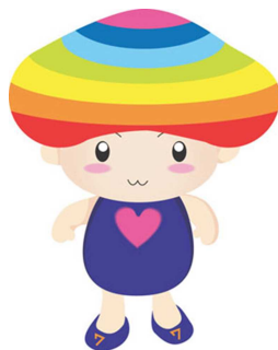
(イベントキャラクター・ヘプタゴン)