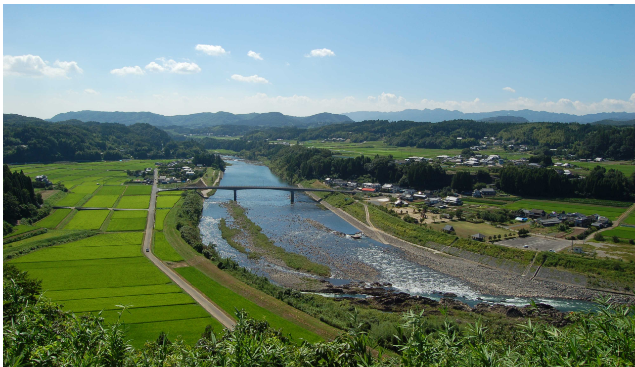
江内戸の景（道の駅みえにて撮影）